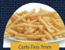
Corte Fino 7mm

A Lamb Weston® oferece uma variedade de produtos de alta qualidade, que ajuda em manter seus clientes retornando, maior lucratividade e eficiência na cozinha.