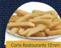
Corte Restaurante 12mm