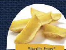
Stealth Fries® Potato Dippers