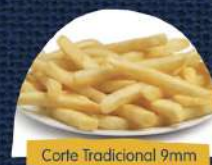
Corte Tradicional 9mm