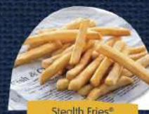
Stealth Fries® Crocante 9mm