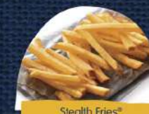
Stealth Fries® Crocante com casca 9mm