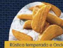
Rústica temperada e Ondulada